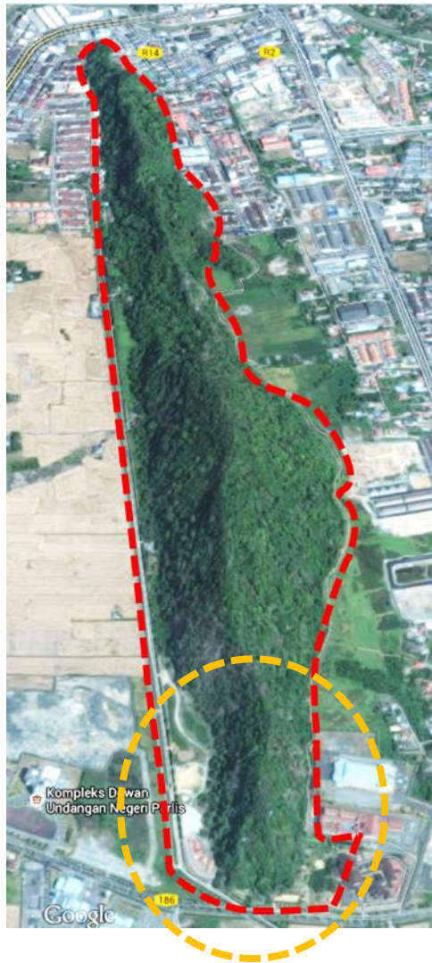
LOKASI CADANGAN BAIKPULIH