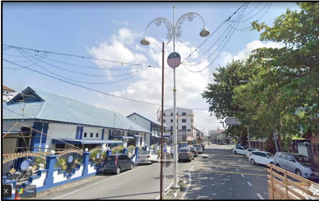
JALAN PERSIARAN JUBLI EMAS