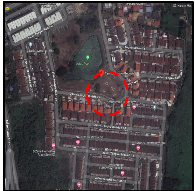
Taman Tengku Budriah