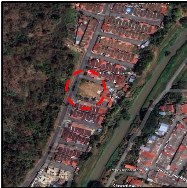
Taman Bukit Kayangan