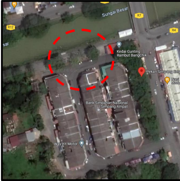
Pekan Simpang Empat