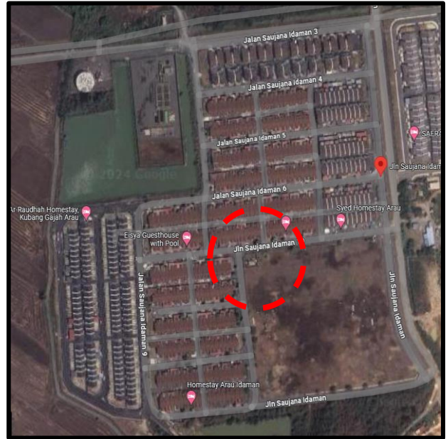
Taman Saujana Idaman