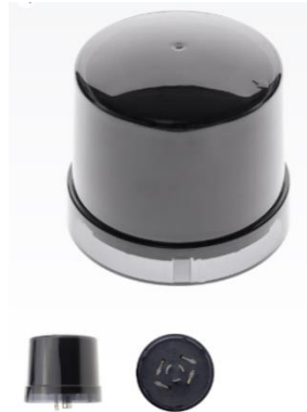
Nema Light Controller.